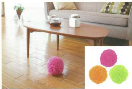
シー・シー・ピー

ふわふわの球体がなんとも愛らしい姿。実は球体型のお掃除ロボットなんです。ボタンを押してスタートするとコロコロと転がってお掃除をはじめてくれます。15分で畳1~2畳分の埃をキャッチしてくれます。マイクロファイバーでできたカバーは取り外して水洗いのできることでとても衛生的。価格も3,980円とお手頃で手が届きやすいですね。