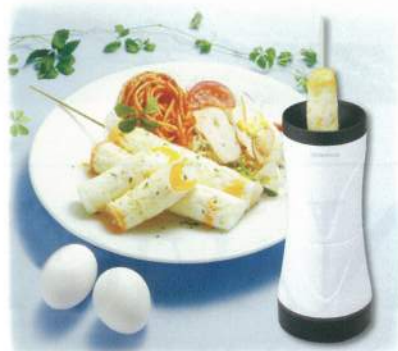
イサムコーポレーション

といた卵をいれて串を刺すだけでロール状の卵焼きが完成！卵焼きだけでなく、ホットケーキやアメリカンドッグ、オムそばなどもできる優れものです。出来上がると水蒸気の力で自動的にポップアップする仕様で火加減も気にする必要がないので忙しい朝にぴったり。