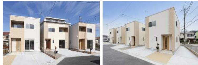
メゾン・ド・ヴェルジェ

元々は約500坪の農地でしたが、お施主様の思いや市場性と事業性の観点から「戸建賃貸」と「福祉施設」の複合型での土地活用をご提案しました。同じ敷地の中に子育て世代の入居が多いナビキューブとデイサービスが入ることで、多世代がゆるやかにつながる場が出来上がりました。