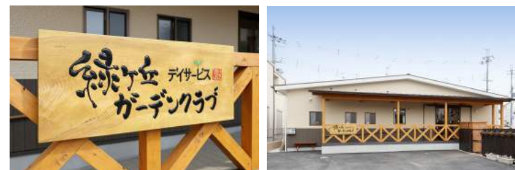
緑ヶ丘ガーデンクラブ